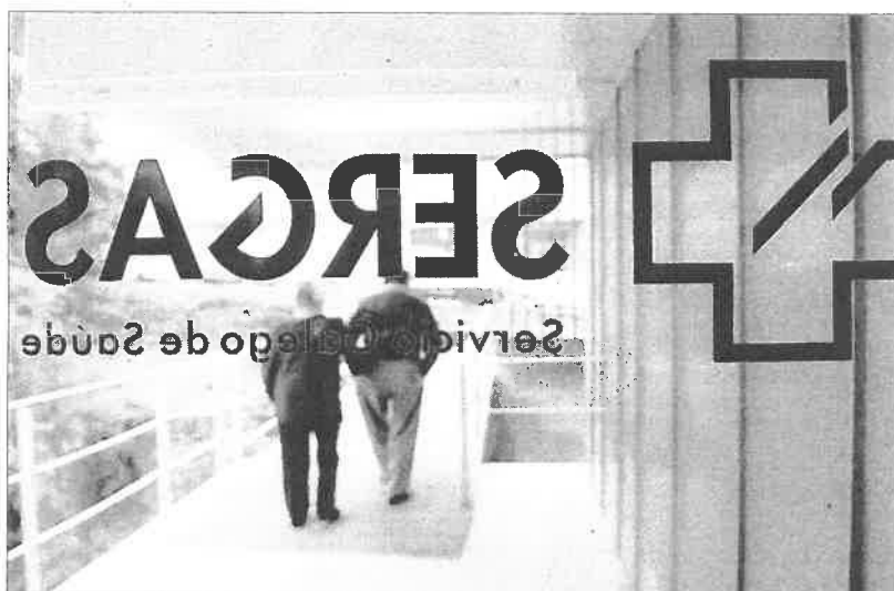
Una pareja accede a un centro de salud gallego.

Pero más allá del tratamiento más idóneo o de cómo abordar una patología una vez diagnosticada, los pacientes deben conocer que muchas enfermedades presentan síntomas diferentes si aparecen en hombres y mujeres y que no siem-