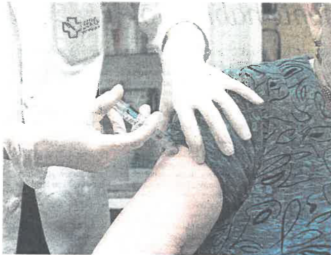
Sanidade hace un llamamiento especial a los mayores para que se vacunen

Los objetivos para la campaña de este año se centran, sobre todo, en la prevención, por lo que Sanidade anima a la población a "protegerse y prevenir la gripe y sus complicaciones". Por ello, buscan un