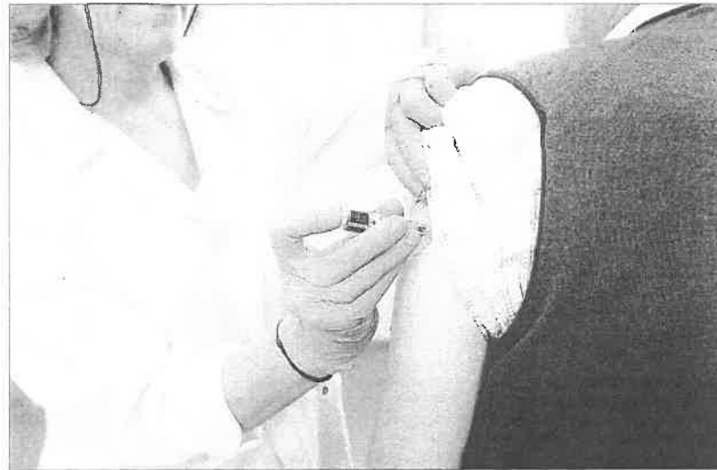
Una sanitaria vacuna a un hombre en un centro de salud de A Coruña.

Una de cada cuatro solicitudes se formularon en A Coruña, el área sanitaria de Galicia en la que más pacientes ya tienen fecha fijada para inmunizarse del virus