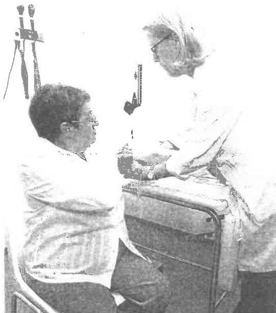
Las vacunaciones comenzarán mañana en toda Galicia

En la campaña se habilitarán 900 puntos de vacunación distribuidos entre centros de salud